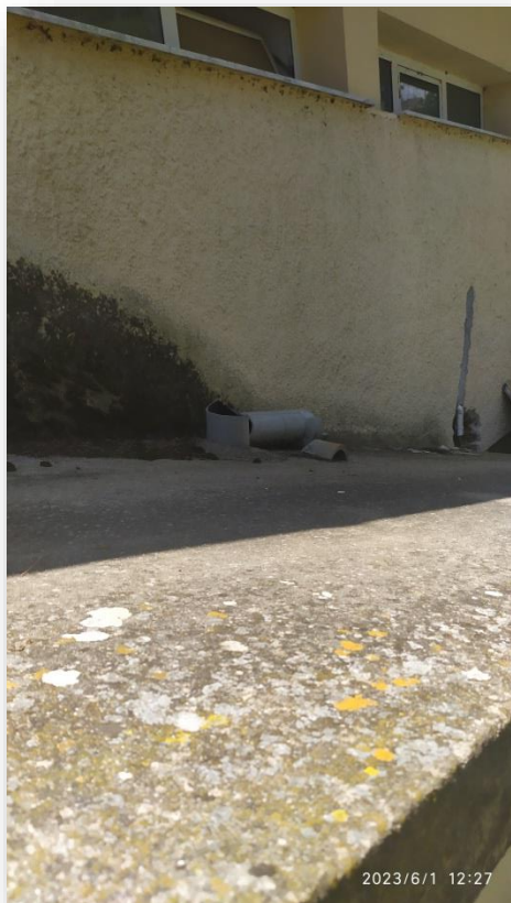
Η. Επισκευή καπνοδόχου λεβητοστασίου.