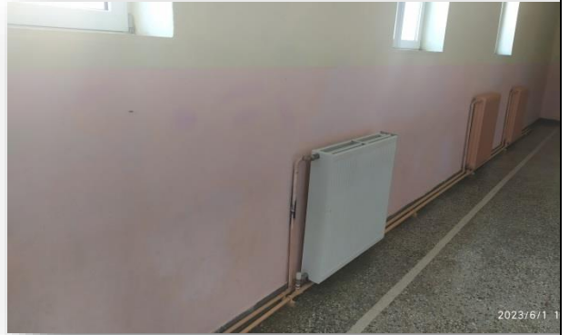
Β. Χρωματισμός εσωτερικών τοίχων διαδρόμων ισογείου και ορόφου, έως το ύψος 1,55μ από το δάπεδο.