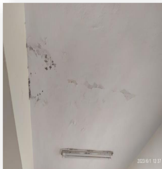
Θ.Επισκευή επιχρισμάτων και βαφών οροφής τοπικά, εσωτερικά του νηπιαγωγείου (2.60 X 4.60).

Τα προϊόντα καθαίρεσης κ.λπ., θα μεταφέρονται είτε με τα χέρια, είτε με μονότροχα καροτσάκια, είτε με μηχανικά μέσα (χωρίς συλλογής υλικών καιμπαζών)εκτόςτουκτιρίου και θαπροωθούνταιμεφορτηγάσεμονάδαεπεξεργασίας, συμβεβλημένημεσυλλογικόσύστημα εναλλακτικής διαχείρισης ΑΕΚΚ.