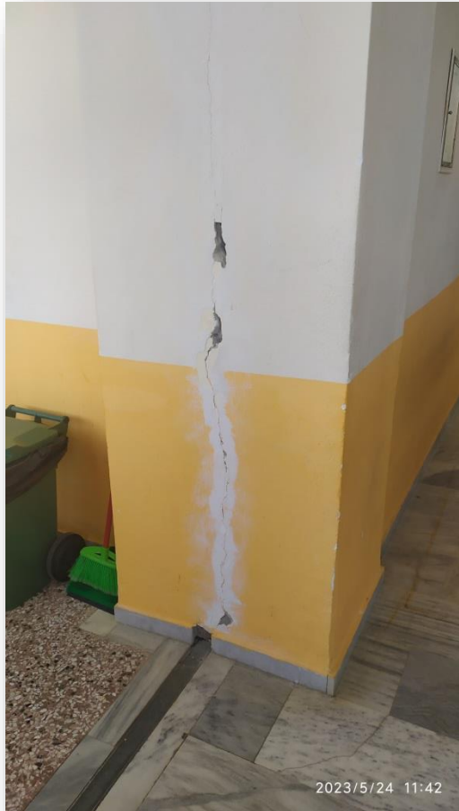
A. Σφράγιση ρωγμής στον διάδρομο του ορόφου και αποκατάσταση αυτής.