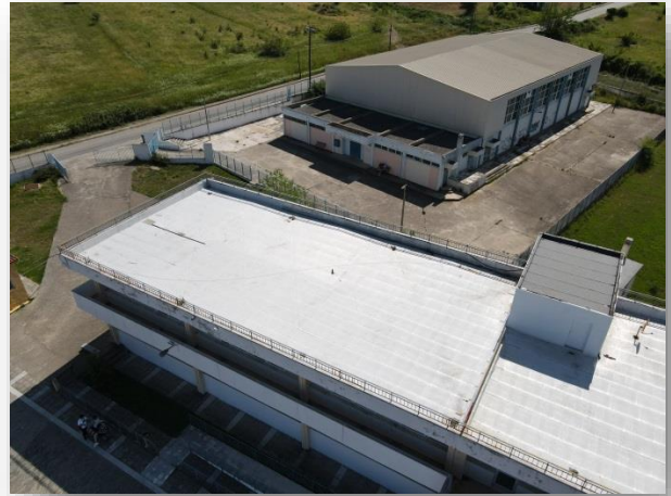
Γ. Επισκευή και αντικατάσταση μόνωσης ταράτσας του βόρειου τμήματος όπου δημιουργούνται διαρροές νερού, κυρίως εντός αίθουσας πρώην πληροφορικής.