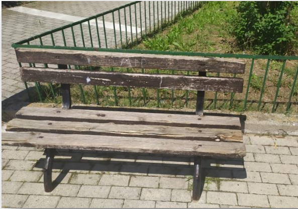
Η. Επισκευή 7 υπαρχόντων πάγκων .